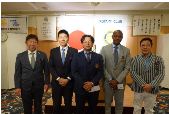
5月お誕生日のお祝い