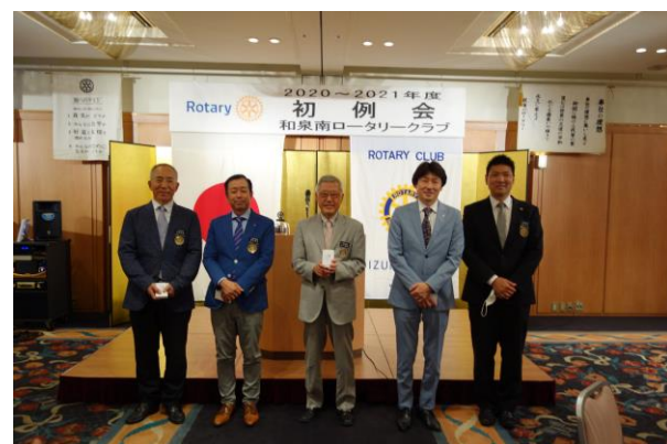
7月お誕生日のお祝い