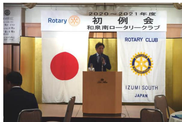
嘉手納会長「所信表明」