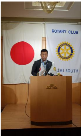
森クラブ奉仕担当理事