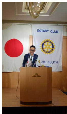
高原職業奉仕担当理事