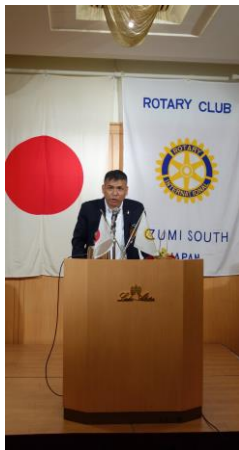
伊藤社会奉仕担当理事