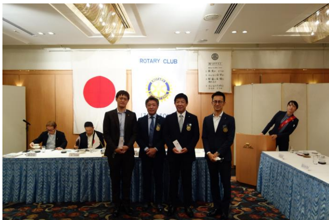
8月創業記念日のお祝い