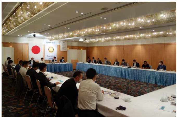
第1回クラブ協議会(全委員会出席)